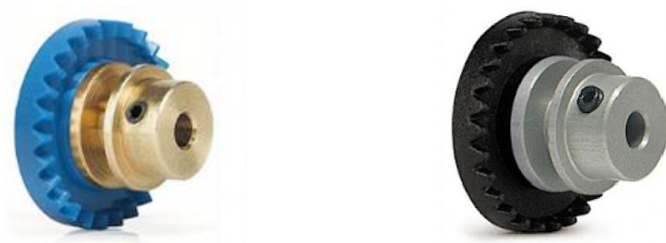
IMAGEN 3. Ejemplos de coronas elegibles

La corona y piñón pueden ser de cualquier marca, la relación puede ser libre. Se admiten reemplazos de la corona original.