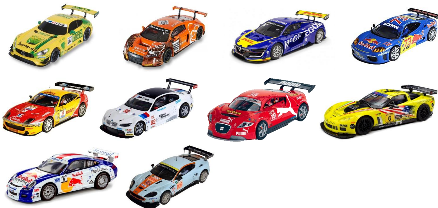
IMAGEN 1. Ejemplos de autos elegibles para la categoría.

Se entiende como Scalextric GT todo auto gran turismo producido por Scalextric (España) desde la Era de Tecnitoys hasta la actualidad de Scale Competition Xstream en cualquiera de sus decoraciones excluyendo a los autos de la Serie PRO o Altaya.