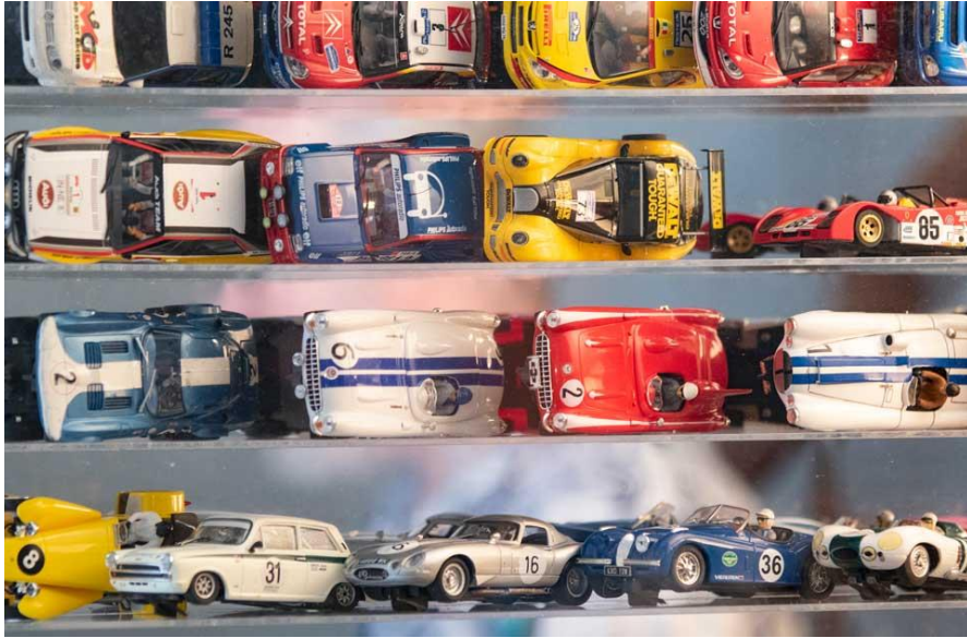
IMAGEN 1. Imagen ilustrativa de autos elegibles.

Se entiende como libre sin imán a cualquier auto de slot escala 1:32 producido por alguna marca comercial con un tiraje mayor a 100 unidades. Se excluyen autos de fabricación casera o artesanal.