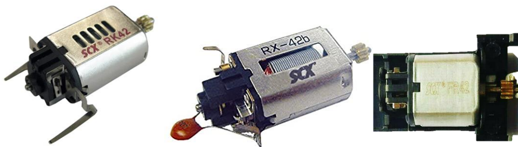
IMAGEN 2. Ejemplos ilustrativos de motores elegibles.

Queda estrictamente prohibida cualquier alteración al embobinado y armadura del motor, así como cualquier alteración que incremente sus prestaciones en comparación a las de fábrica. Está permitido fijar las pletinas del motor al chasis y eliminar el condensador.