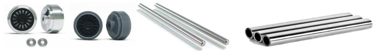
IMAGEN 4. Ejemplos de ejes y rines elegibles.