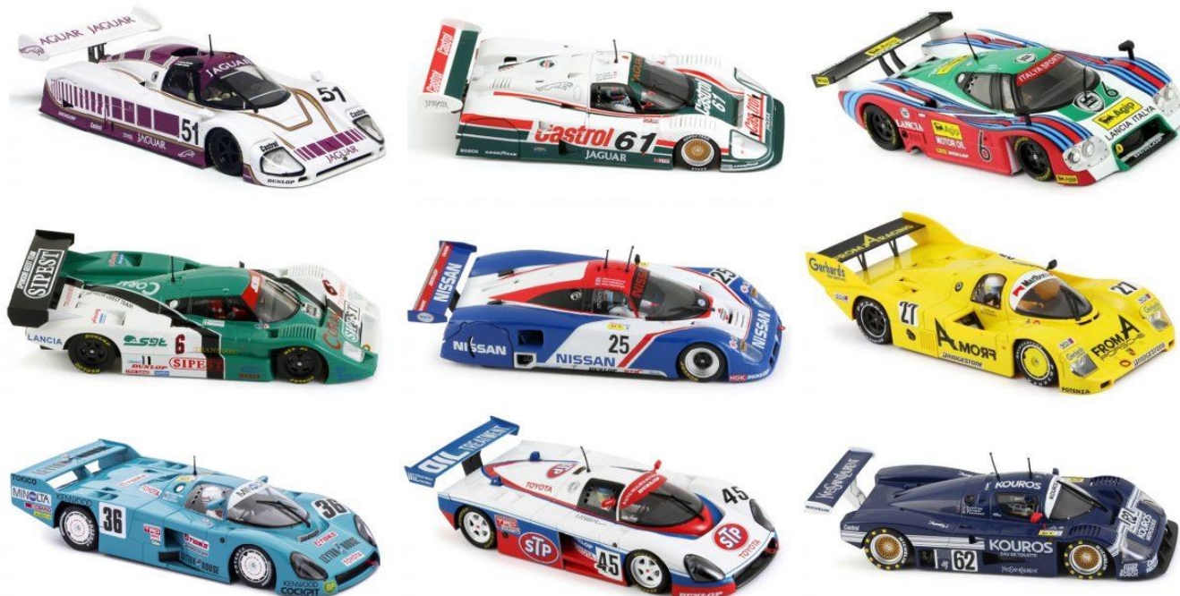
IMAGEN 1. Ejemplos de autos elegibles para la categoría.

Se entiende como Grupo C de Slot.it a cualquier auto sport prototipo perteneciente al Grupo C (1982-1992) de la FIA producido por Slot.It (Italia) en cualquiera de sus decoraciones.