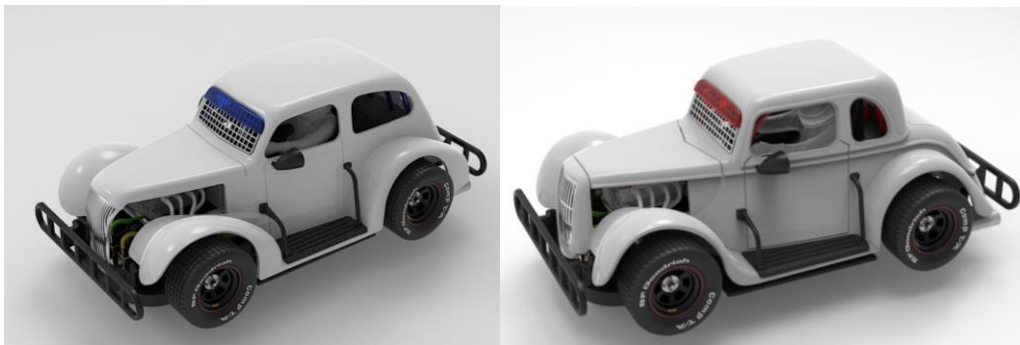
Ejemplos de autos elegibles para la categoría.

Se entiende como Legends a cualquier auto fabricado por la compañía Pioneer que evoque un modelo de los años 1934-1937 de las marcas Chevrolet, Dodge y Ford. En cualquiera de sus decoraciones originales o kits para armar.