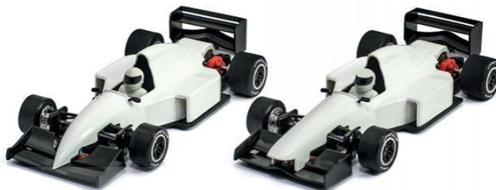
Ejemplos de autos elegibles para la categoría.

Se entiende por Formula SC a cualquier auto Formula 90-97, ya sea de nariz baja o nariz alta, producido por la marca Scaleauto en cualquiera de sus decoraciones o decorado de manera realista o ficticia.