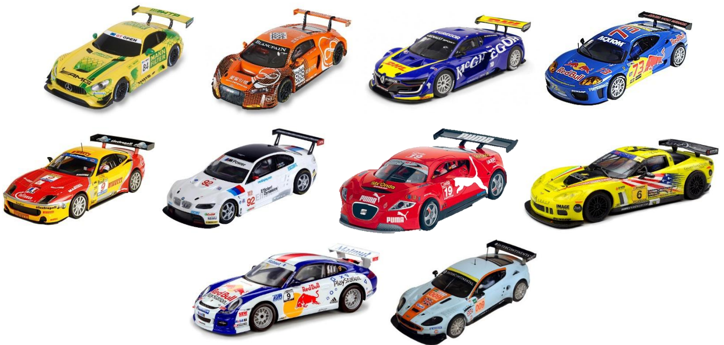
IMAGEN 1. Ejemplos de autos elegibles para la categoría.

Se entiende como Scalextric GT todo auto gran turismo producido por Scalextric (España) desde la Era de Tecnitoys hasta la era actual de Scale Competition Xtream en cualquiera de sus decoraciones excluyendo a los autos de la Serie PRO y Altaya.