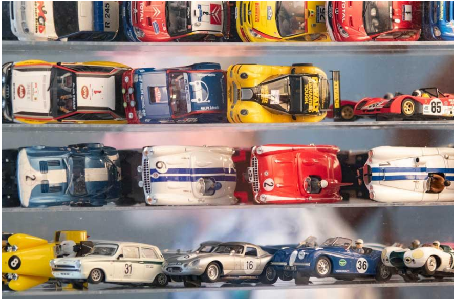
IMAGEN 1. Imagen ilustrativa de autos elegibles.

Se entiende como libre sin imán a cualquier auto de slot escala 1:32 producido por alguna marca comercial con un tiraje mayor a 100 unidades. Se excluyen autos de fabricación casera o artesanal.