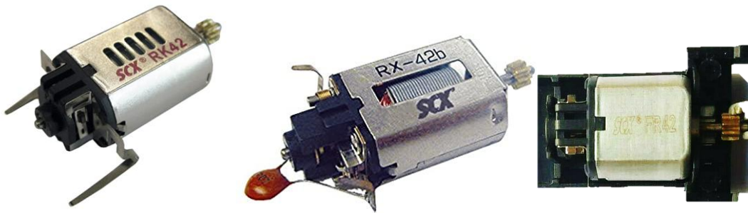
IMAGEN 2. Ejemplos ilustrativos de motores elegibles.

Queda estrictamente prohibida cualquier alteración al embobinado y armadura del motor, así como cualquier alteración que incremente sus prestaciones en comparación a las de fábrica. Está permitido fijar las pletinas del motor al chasis y eliminar el condensador.