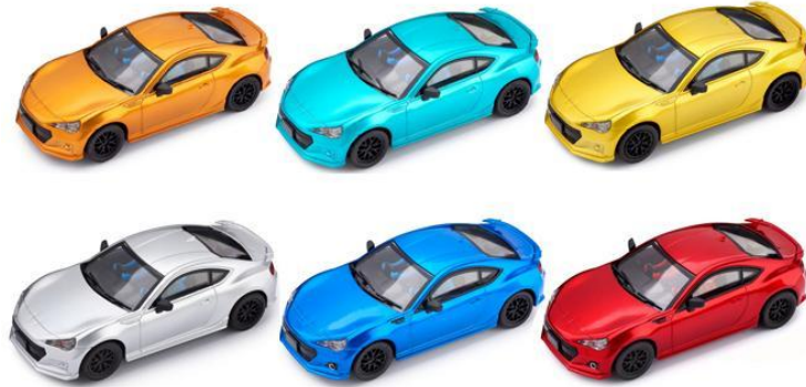
IMAGEN 1. Ejemplos de autos elegibles para la categoría.

La categoría consta de 4 autos proporcionados por el club con características iguales identificados por el color de su carrocería o etiquetas y que no pueden ser intercambiados de carril. Cada piloto manejará el auto en el carril correspondiente y conservará su posición en la pista al cambiar de carril, sin embargo, cambiará al auto que corresponda al siguiente carril.