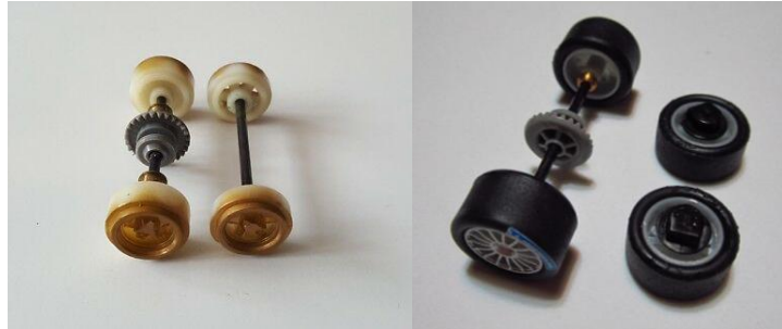
IMAGEN 4. Ejemplos de ejes y rines elegibles.

Solo se admiten rines plásticos y ejes producidos por el fabricante, se permite intercambiar rines de un modelo a otro siempre y cuando no requieran adaptaciones, se permite fijar los rines a los ejes con pegamento, no se permiten rines de resina o aluminio. No se permite material calibrado. Los semiejes de fábrica están permitidos. El conjunto ejes y rines no puede sobresalir de la carrocería visto desde una perspectiva superior.